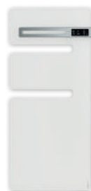
Czysta biel (Mat)